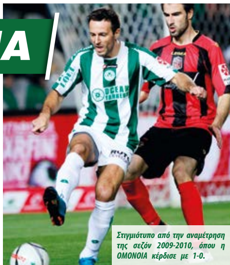
Στιγμιότυπο από την αναμέτρηση της σεζόν 2009-2010, όπου η ΟΜΟΝΟΙΑ κέρδισε με 1-0.