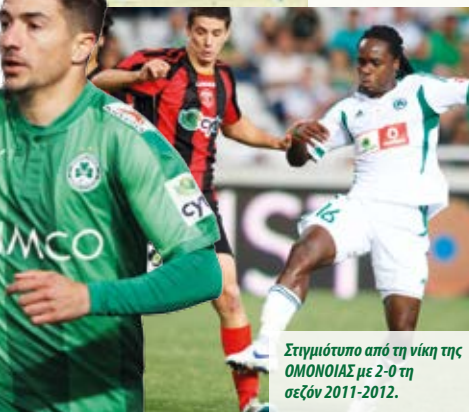
Στιγμιότυπο από τη νίκη της ΟΜΟΝΟΙΑΣ με 2-0 τη σεζόν 2011-2012.