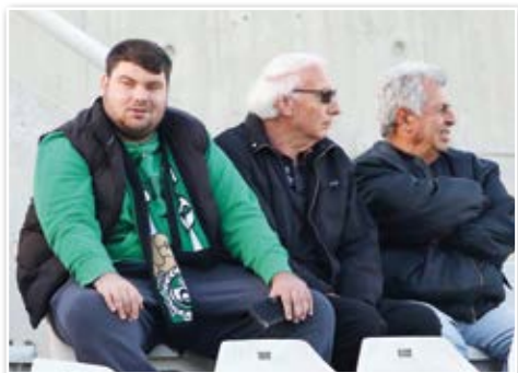
Η παρουσία του κόσμου της ΟΜΟΝΟΙΑΣ στα παιχνίδια με Απόλλωνα και Νέα Σαλαμίνα.