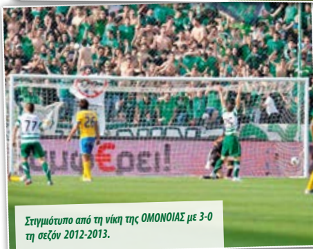
Στιγμιότυπο από τη νίκη της ΟΜΟΝΟΙΑΣ με 3-0 τη σεζόν 2012-2013.