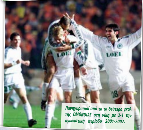
Παληγυρισμοί από το το δεύτερο γκολ της ΟΜΟΝΟΙΑΣ στη νίκη με 2-1 την αγωνιστική περίοδο 2001-2002.